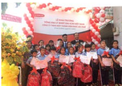
Trao học bổng cho học sinh vượt khó học giỏi nhân dịp khai trương Văn phòng Tổng Đại lý Thủ Đức 3, TP. HCM vào ngày 5/11/2019.