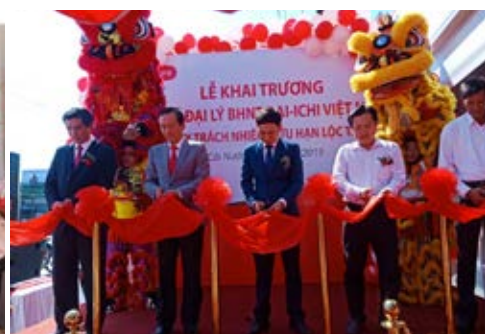
Cắt băng khai trương Văn phòng Tổng Đại lý Cái Nước, tỉnh Cà Mau vào ngày 6/12/2019.