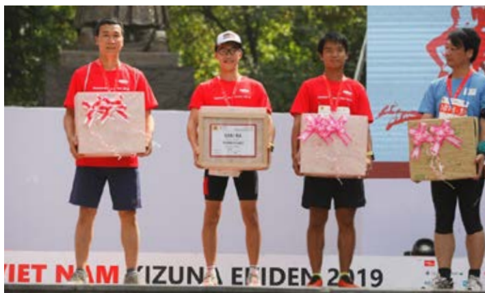
Đội đạt Giải Ba nội dung Ekiden với thành tích 48 phút 21 giây.