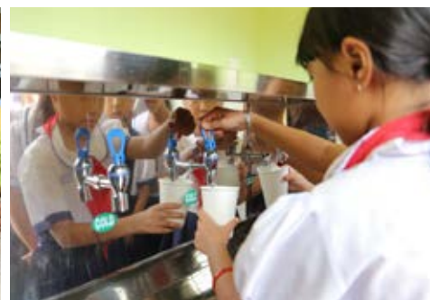
Học sinh trường Tiểu học Phan Thế Dũng đã được sử dụng nước uống sạch ngay tại trường.