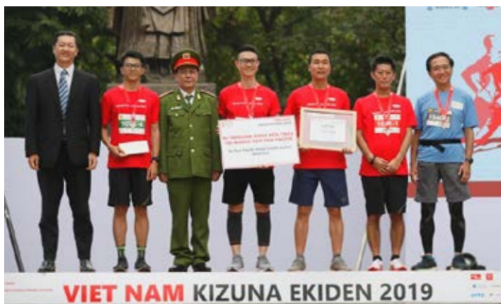
Đội có số BIB 1051 đạt Giải Ba nội dung Kizuna (áo đỏ) với thành tích 58 phút 25 giây.