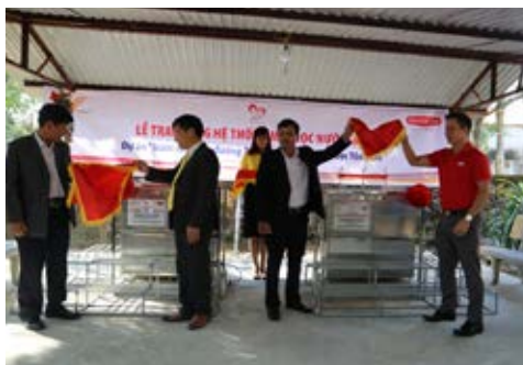
Hai đơn vị tài trợ thực hiện nghi thức khánh thành và bàn giao công trình nước sạch tại trường Tiểu học Yên Tâm, tỉnh Thanh Hóa.

Sáu công trình này nằm trong dự án "Nước sạch học đường 2019" với ngân sách 600 triệu đồng , do Quý Vì cuộc sống tươi đẹp của Dai-ichi Life Việt Nam tài trợ và phối hợp cùng VNPost để lắp đặt hệ thống máy lọc nước cho 10 trường học tại các tỉnh thành trên cả nước, bao gồm: Thanh Hóa, Quảng Ninh, Lào Cai, Bình Thuận, Kiên Giang, Tây Ninh, Thái Bình, Đắk Lắk, Quảng Nam, và Bến Tre.