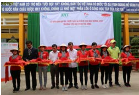
Cắt băng khánh thành Công trình Nước sạch và Nhà vệ sinh tại trường Tiểu học Phan Thế Dũng, tỉnh Tiền Giang.

Công trình bao gồm 1 hệ thống lọc nước, 1 nhà vệ sinh (3 phòng vệ sinh nam và 3 phòng vệ sinh nữ), 1 hệ thống bồn rửa tay và 1 sân trồng hoa. Cũng nhân dịp này, hơn 50 nhân viên Dai-ichi Life Việt Nam đã cùng tham gia giao lưu với các em học sinh, tặng quà, trồng cây xanh và vệ sinh khuôn viên trường Tiểu học Phan Thế Dũng.