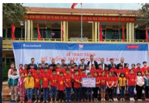
Máy lọc nước uống sạch đã được bàn giao cho trường Tiểu học Tân Thành, tỉnh Ninh Bình vào ngày 14/11/2019.