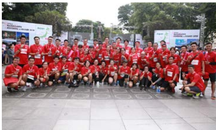
56 vận động viên đã thi đấu hết mình với tinh thần thể thao trung thực và tinh thần đồng đội cao để cùng nhau đạt đến mục tiêu. Tất cả vận động viên của Dai-ichi Life Việt Nam đều là người chiến thắng!