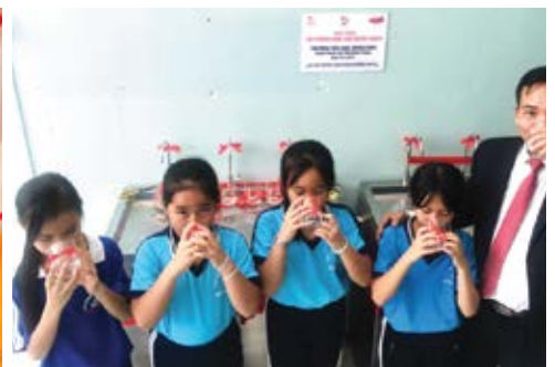
Học sinh trường Tiểu học Sông Dinh, tỉnh Bình Thuận đã có thể được uống nước sạch ngay tại trường.