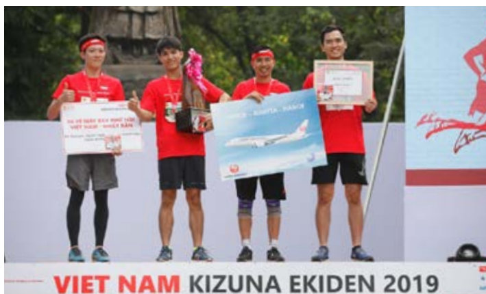
Đội có số BIB 1050 đạt Giải Nhất nội dung Kizuna với tổng thời gian 57 phút 34 giây (13,7km).

Bên cạnh tài trợ sự kiện ý nghĩa này, Dai-ichi Life Việt Nam đã tuyển chọn 56 vận động viên tham gia thi đấu (tăng gấp 4 lần so với năm ngoái) với sự cổ vũ nhiệt tình của hơn 100 nhân viên và tư vấn tài chính. Đoàn vận động viên Dai-ichi Life Việt Nam đã thi đấu rất kiên cường và đạt thành tích ấn tượng với ba giải thưởng: Giải Nhất và Giải Ba Kizuna (dành cho đội có ít nhất 1 thành viên người Nhật bản và 1 thành viên người Việt Nam); Giải Ba Ekiden (dành cho các thành viên bất kỳ). Ngoài ra, với đông đảo cổ động viên trong màu áo đỏ rực nhuộm khán đài, Dai-ichi Life Việt Nam còn được trao Giải Đội Cổ động nhiệt tình nhất .