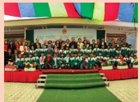
Các em học sinh chụp hình lưu niệm với đại diện Dai-ichi Life Việt Nam và các nhà tài trợ.