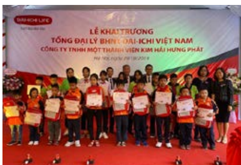
Trao học bổng cho học sinh vượt khó học giỏi nhân dịp khai trương Văn phòng Tổng Đại lý Cầu Giấy 2 vào ngày 29/10/2019.

Trên chặng đường 10 năm, Văn phòng Tổng Đại lý Phú Thọ 1 và Văn phòng Tổng Đại lý Hòa Bình không chỉ ghi dấu ấn về sự lớn mạnh của hệ thống, tăng trưởng nhanh về doanh số mà còn là một trong những doanh nghiệp tiên phong trên địa bàn hai tỉnh trong công tác an sinh xã hội.