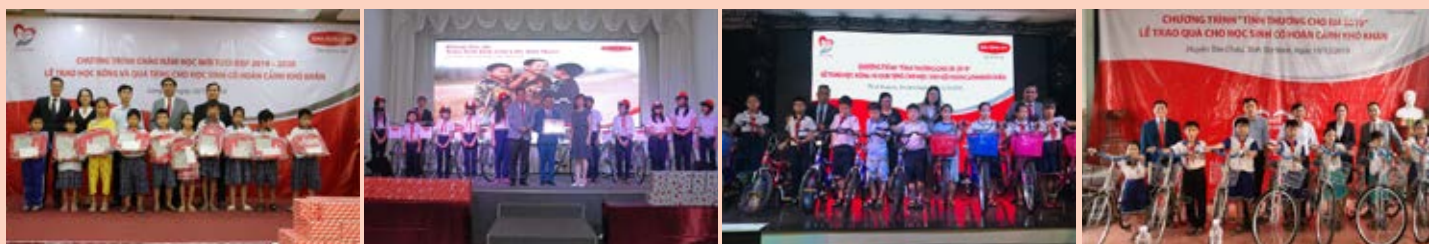
Những suất học bổng và xe đạp từ chương trình “Kết nối yêu thương - Tình thương cho em” được trao cho học sinh tại các tỉnh Long An, Bình Thuận, Bình Dương và Tây Ninh.

Chương trình sẽ tiếp tục được nhân rộng tại nhiều tỉnh thành khác trong thời gian tới, với tổng số tiền dự kiến lên đến hơn 750 triệu đồng cho 1.500 học sinh trên quy mô cả nước.