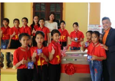
Học sinh trường Tiểu học Vĩnh Thành, tỉnh Nghệ An chụp hình lưu niệm cùng hai đơn vị tài trợ trước công trình nước uống sạch được bàn giao vào ngày 8/11/2019.