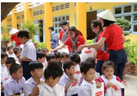
Các em học sinh được tặng quà và giao lưu với các nhân viên Dai-ichi Life Việt Nam.