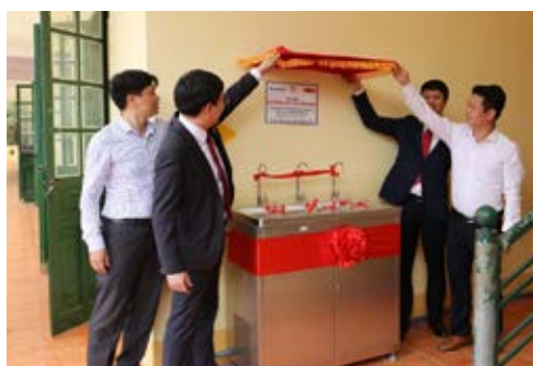
Công trình máy lọc nước uống sạch đã được bàn giao cho trường Phổ thông Dân tộc Bán trú Tiểu học và Trung học Cơ sở Bản Cái, tỉnh Lào Cai ngày 6/11/2019.

Hoạt động này nằm trong Chương trình “Nước sạch học đường” do Dai-ichi Life Việt Nam và Sacombank phối hợp thực hiện. Trong năm 2019, hai doanh nghiệp tài trợ số tiền 500 triệu đồng để lắp đặt hệ thống máy lọc nước uống sạch cho 8 trường học vùng nông thôn tại 8 tỉnh thành, đáp ứng nhu cầu nguồn nước uống sạch thường xuyên cho hơn 2.000 học sinh và giáo viên tại các địa phương còn nhiều khó khăn.